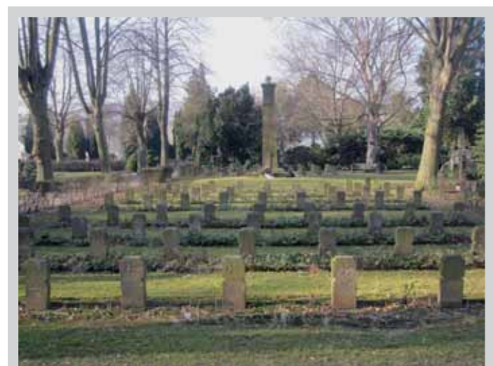
Gefallene des I. und II. Welt- krieges