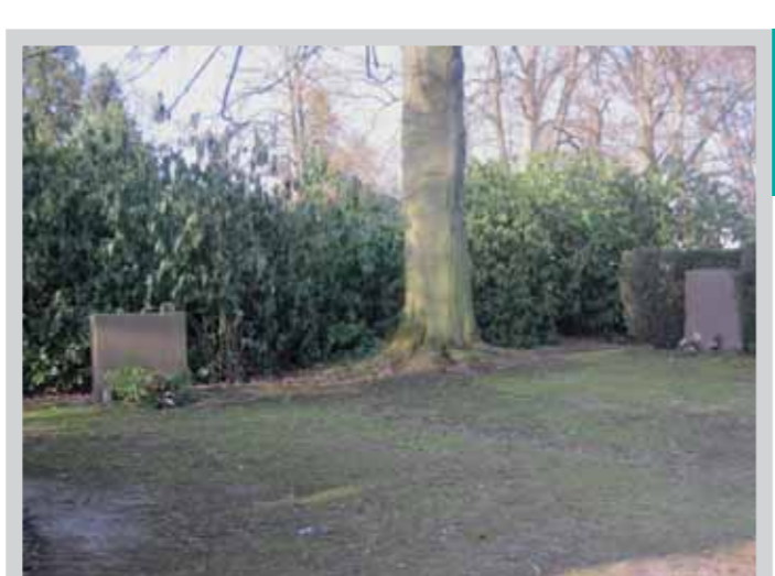
Verstorbene Zwangs- arbeiter/innen