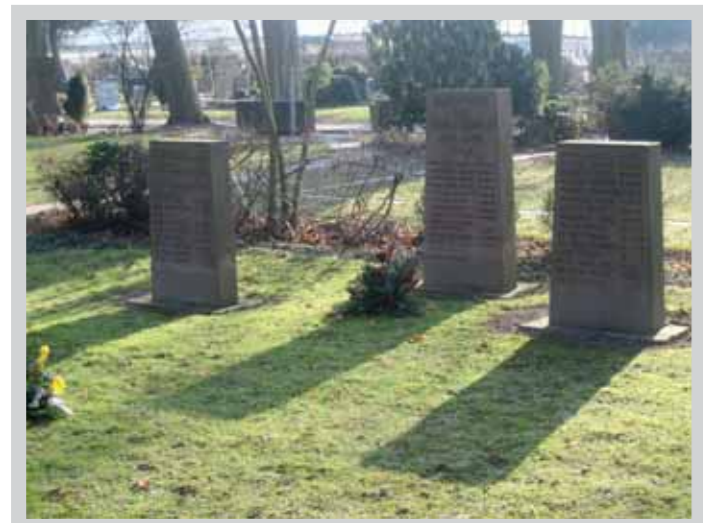
Opfer der Luftangriffe

Plan des Friedhofs mit markierten Kriegsgräberstätten