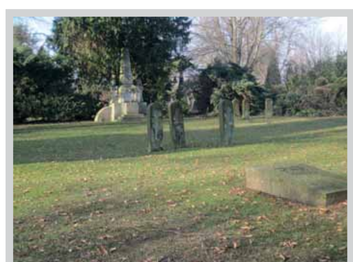
Internierte Ausländer I. Weltkrieg